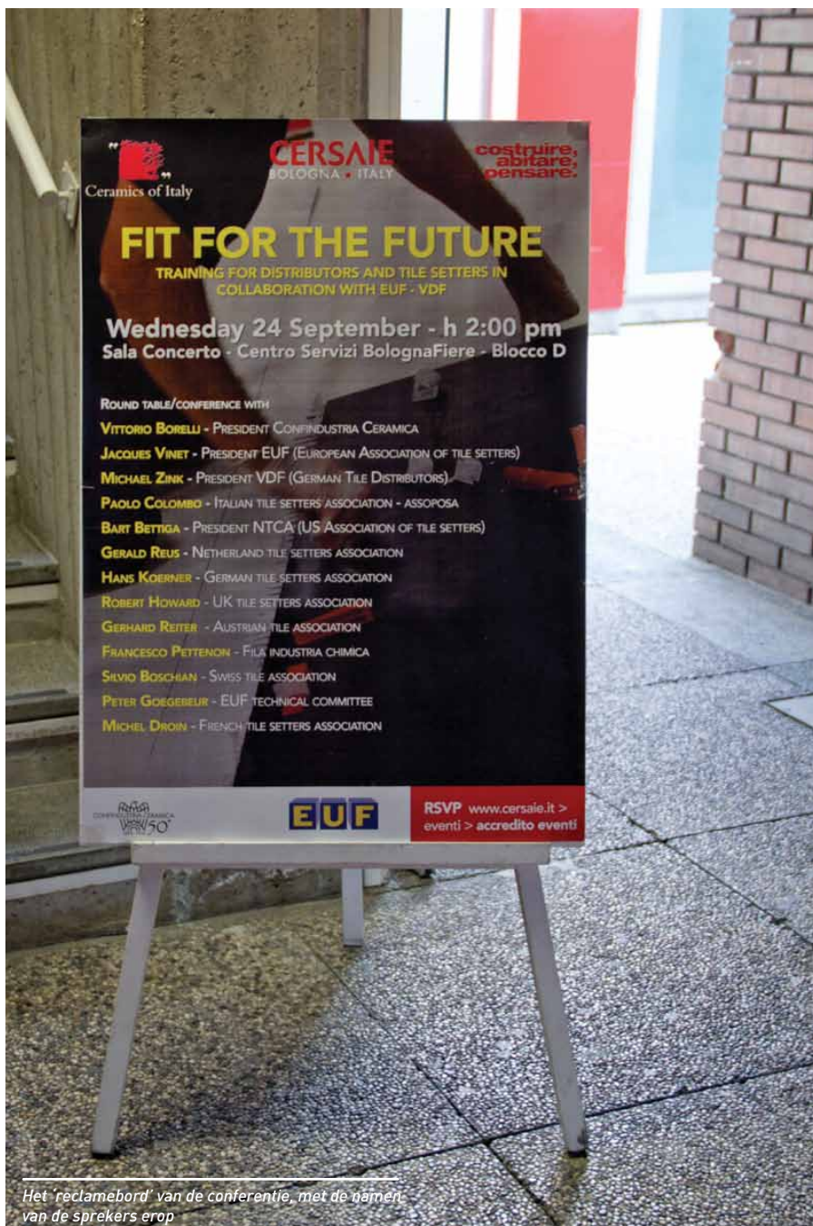
Het 'reclamebord' van de conferentie, met de namen van de sprekers erop