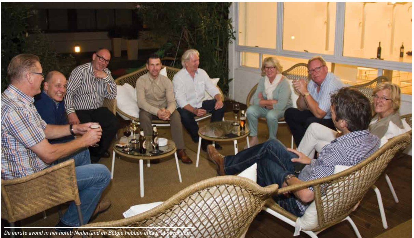
De eerste avond in het hotel: Nederland en België hebben elkaar al gevonden...